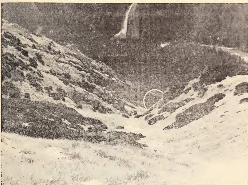
Abb. 5: Blick von oben auf die Lokalität nach Abb. 4. Im Vordergrund eine Murmeltierkolonie, im weißen Kreis hinter dem Felsriff dieselbe Hütte.

der Art Rhinolophus hipposideros aus Mähren folgende durchschnittliche Grenzwerte des Körpergewichts fest: erwachsene Männchen — Minimum 5,6 g im März, Maximum 8,7 g im November; erwachsene Weibchen — Minimum 6,3 g im März und April, Maximum 8,8 g im November. Zu ähnlichen Folgerungen gelangte auch Krzanowski (1961) für einige andere Arten.